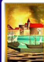
Kultur Karthago Allgemein: ständige Vorfreude, Irrational Liebe: feste Bindung, unEhrlich und Fälschungsbildung Beruf: Sicherer Arbeitsplatz in guter Position Gesundheit: Basketballspielen Zeit: ca. 4 Jahre