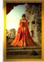
Kultur Neandertaler Allgemein: Nachrichten, Heiß, aufregende Ideen Liebe: Neandertaler, Unruhe Beruf: Stress und Entlohnungen, schlechte Handelt ist engpassig Gesundheit: auf die Nerven achten Zeit: Ehe ist geordnet, 1-2 Wochen