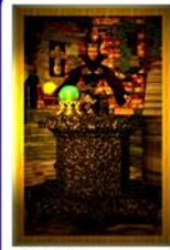
Kultur Hwaakul Allgemein: Manipulation, Magie Liebe: Manipulation, Liebeskult, erweihen einer Partnerschaft, nicht lassen können Beruf: Manipulation zu eigenen Zwecken Gesundheit: Krankheitserreger, ungesunde Therapie Zeit: hängt von dem Charakter und Schutzmaßnahmen ab