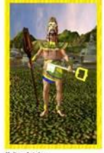
Kultur Azteken Allgemein: Lösung finden, Strategie, Erkenntnis Liebe: Richtigen Partner finden oder erkennen Beruf: Fleiß bringt Erfolg, Strategie Gesundheit: zehnjährige Therapie finden Zeit: lange Dauer