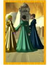
Kultur Babylon Allgemein: Hochmut, Kommunikationsprobleme Liebe: an einander vorbei, reden miteinander Beruf: große Pläne, will zu große Pläne Gesundheit: über Gesundheitsfragen reden Zeit: hängt von guter Kommunikation ab