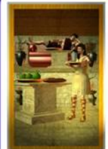
Kultur Drexler Allgemein: Harmonie, Schwigen, Bescheidenheit Liebe: Sexualität steht ein Vordergrund, Altru Beruf: ein Mann der Arbeit Gesundheit: Sexualverkehr Zeit: Winter