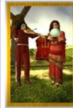
Kultur umherziehendes Volk Allgemein: Situationen ändern sich schnell Liebe: kurzfristig auf Wutten schauen Beruf: kurzfristige Jobs, zeitlich begrenzte Jobs Gesundheit: Musik, Natur und Freiheit ist gut Zeit: 3-4 Tage