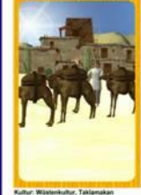
Kultur Wasserkultur: Taktikern Allgemein: hartes Wasserleben, immer mit Störmen rechnen Liebe: mit wenigen Störmen ist zu rechnen Beruf: harte Arbeit, große und lange Wege, technischer Bereich Gesundheit: Krankheiten durch Hitze und Staub, Zeit: ca. 12 Stunden