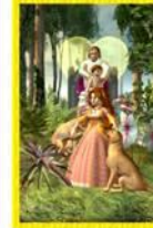
Kultur Bogomles Allgemein: Liebe, Herrlichkeit, Müdigkeit Liebe: Verheiratet sein, Lieben, geliebt werden Beruf: mit Herz und Seele Beruf ausüben Gesundheit: Herz Zeit: Frühling