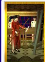
Kultur Priester Allgemein: Schulbildung, Lernen Liebe: eine Beziehung in der man gegenseitig etwas lernt Beruf: Fortbildung, Umschulung, Weiterbildung Lebensart: Gesundheit: Kapitalreich Zeit: von dem Lernniveau abhängig