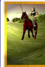
Kultur Hunnen Allgemein: Schnelligkeit Liebe: Leidenschaft, sexuelles Verleiten, Kurzschlußhandlungen Beruf: schnelle und operative Entscheidungen nötig Gesundheit: Beine Zeit: schnell, wenig Zeit