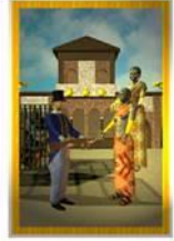
Kultur Araber Allgemein: Verbot Liebe: Verbot, Betrug, verbotene Ehe, mehrere Frauen Beruf: Verbot, Kompromis, Regeln Geschäfte Gesundheit: Länderspieler, Verletzung Zeit: Verhalten wird Folgen haben